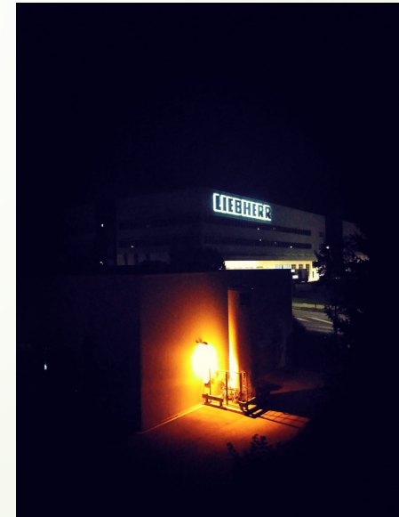
Eine der Firmen ist Liebherr.