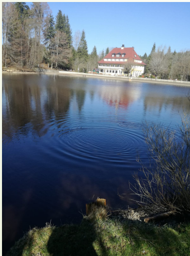
Das Waldsee Bad mit kostenlosen eintritt.