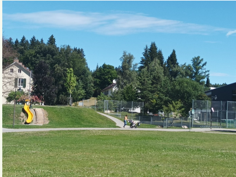
Unser Stadtpark perfekt zum Chillen und Fussballspielen